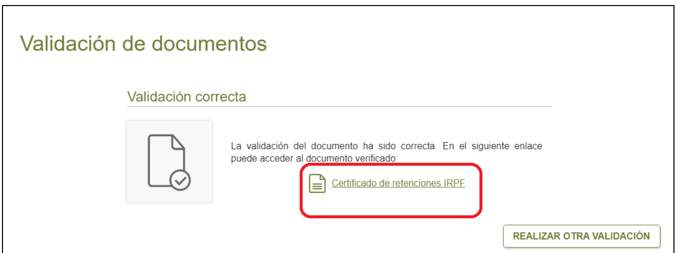
Figura 2. Resultado de la validación del documento